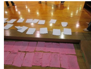
道場入り口で足を消毒靴下なし