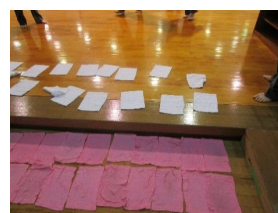
道場入り口で足を消毒靴下なし