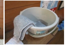
バケツとモップ先端